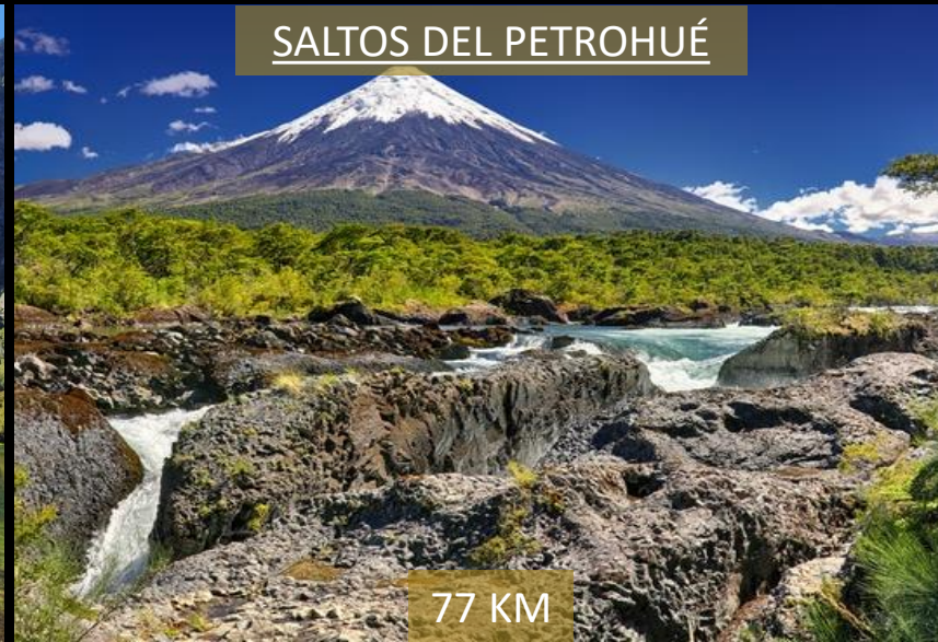
SALTOS DEL PETROHUÉ