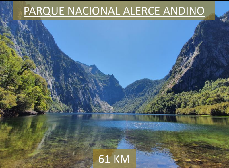
PARQUE NACIONAL ALERCE ANDINO